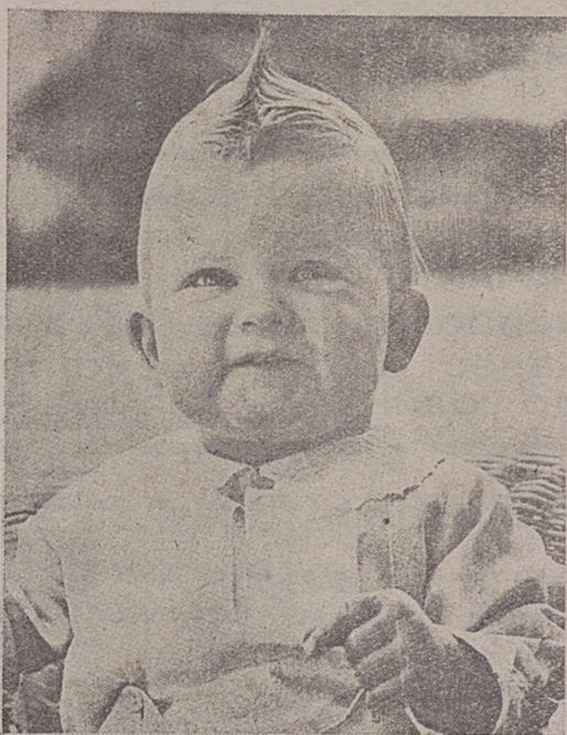
Най новия портретъ на престолонаследника

Именния ден на престолонаследника праздника на земята