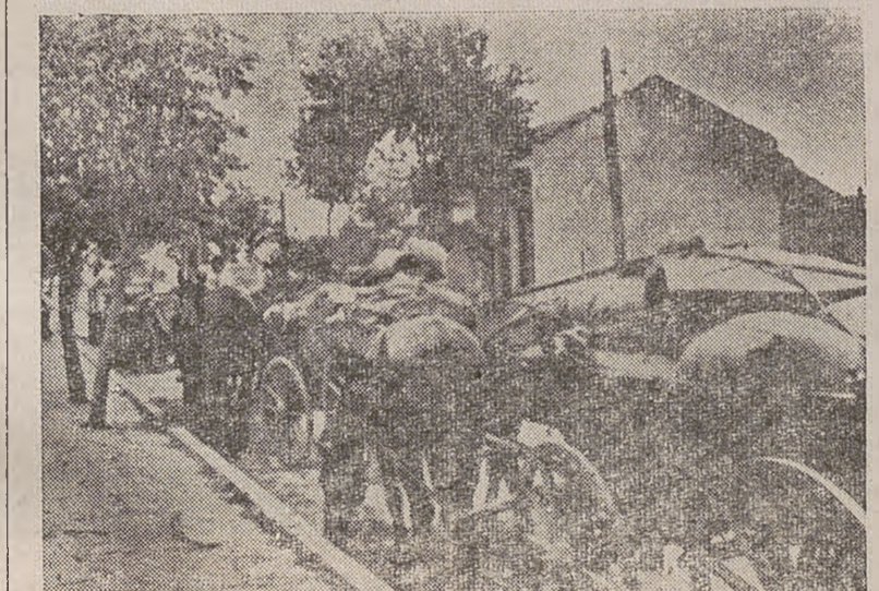
Първият керван в Поповско от ТКЗС с. Гагово

Ценна роля и добра помощ за навременното извършване на подметката дадоха младежите—членове на ДСНМ. Добре разбрали значението на навременното извършване на подметката те проведоха организационно събрание, на което изработиха план и поставиха сериозно въпроса за участие то на младежите в подметката.