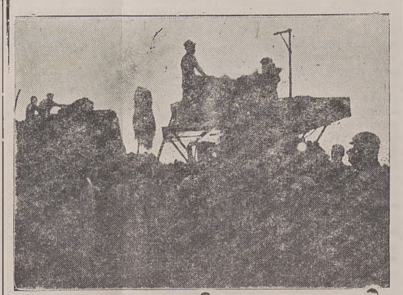
Нощна вършитба в с. Кочово, Преславско

Наред с вършитбата се извършва и подметката на сърнищата. До сега е извършена подметка на 20 хиляди декари, при план 25 хиляди декари. Хордът на подметката се затруднява поради неразчистване на блоковете от снопи. Много от ТКЗС приключиха с подметката, като